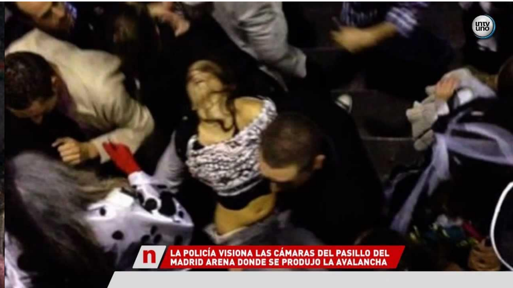
LA POLICÍA VISIONA LAS CÁMARAS DEL PASILLO DEL MADRID ARENA DONDE SE PRODUJO LA AVALANCHA